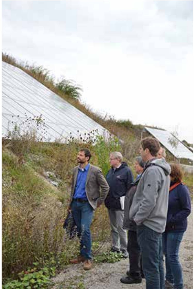
Abbildung 2: Rundgang in Crailsheim im Jahr 2016.

Für Nachahmer: Erster Einstieg ist eine Untersuchung der Abwärmepotenziale einer Kommune. Der Bund bezuschusst Teilklimaschutzkonzepte zur "Integrierten Wärmenutzung". Die größte solarthermische Anlage Deutschlands lädt zur Nachahmung ein! Wir brauchen noch viele Solarstädte!